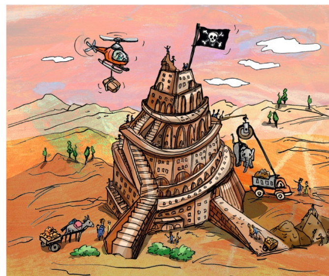
Lösung: Hubschrauber, Piratenfahne, Lastwagen, Elefant

früher zu erklären versuchten, warum sie alle verschiedenen Sprachen sprechen. Und die uns erzählt, dass es nicht richtig ist, wenn Menschen wie Gott sein wollen. Ein Fehler. Findet ihr auch die vier anderen Fehler im Bild?